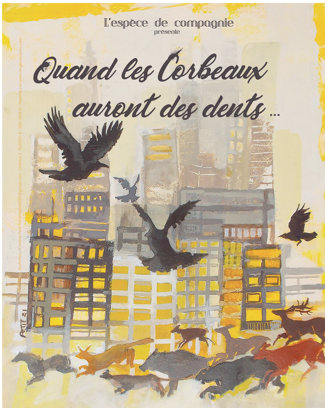
Licence 2 : PLATESY - R. 2021-0029115 - Imprimé par www.sergentpoppers.com

Spectacle avec plein d'objets et une marionnette pour tout mammifère à partir de 7 ans.